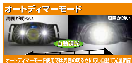
オートディマーモード使用時は周囲の明るさに応じ自動で光量調節