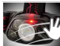
センサースイッチ モード搭載